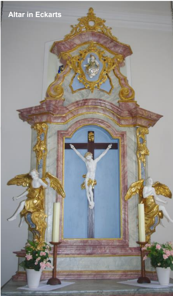
Altar in Eckarts