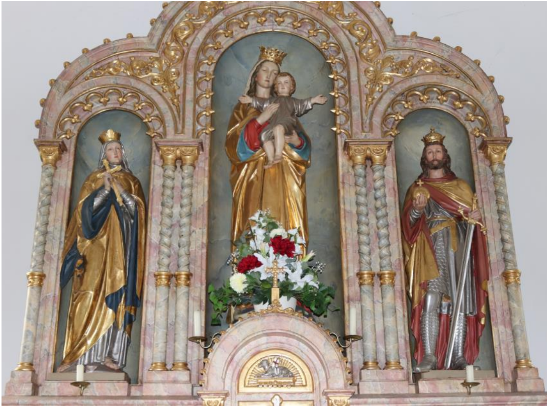
Kunigunde, Madonna und Heinrich im Altar in Gräfenneuses