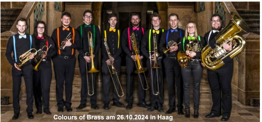
Colours of Brass am 26.10.2024 in Haag